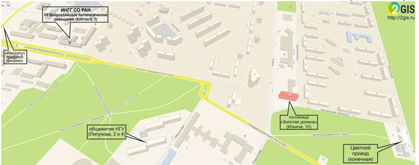
Схема подходов к месту проведения VII Всероссийского литологического совещания - главному корпусу Института нефтегазовой геологии и геофизики СО РАН (проспект Коптюга, 3) от: автобусных остановок «Институт ядерной физики (ИЯФ)» и «Цветной проезд» (конечная); гостиницы «Золотая долина» (ул. Ильича, 10) и общежитий НГУ (ул. Ляпунова 2 и 4)