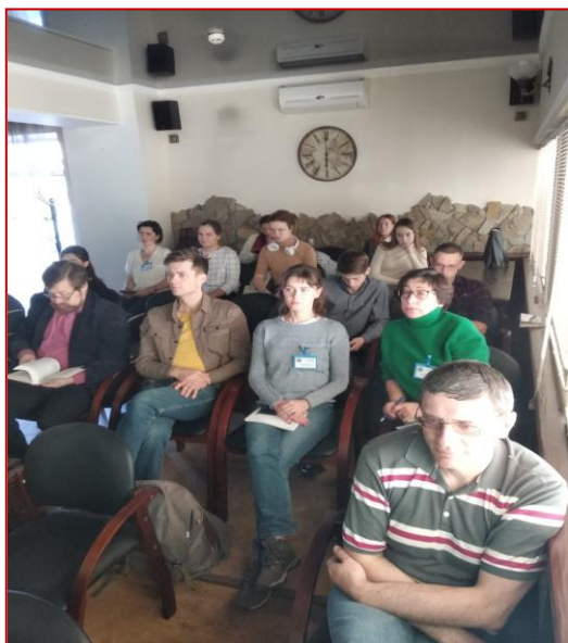
Рис. 1. Зал заседания ТюмНЦ СО РАН, работа симпозиума

Международный научный симпозиум состоялся 26-27 октября на базе Тюменского научного центра СО РАН. Инициатором его проведения стали Омская лаборатория археологии, этнографии и музееведения ИАЭТ СО РАН и Институт проблем освоения Севера ТюмНЦ СО РАН. В состав соорганизаторов вошли Омский государственный университет им. Ф. М. Достоевского, Омский научный центр СО РАН и Павлодарский педагогический университет (Республика Казахстан).