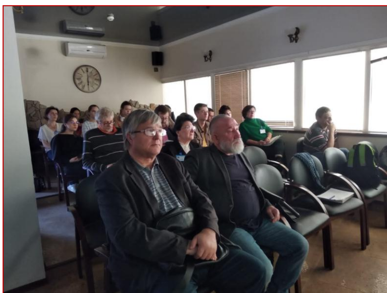
Рис. 5. Зал заседания ТюмНЦ СО РАН, работа симпозиума