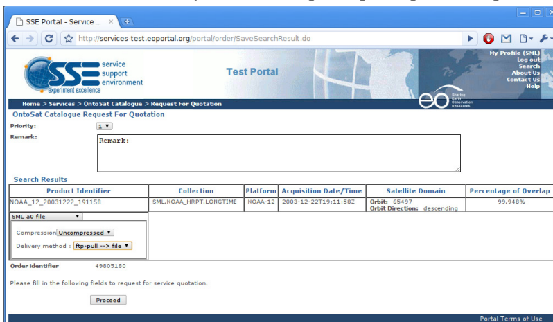
Рис. 2. Задание опций получения продукта в реализованном прототипе интерфейса заказа

Кроме того, реализован прототип сервиса заказа на обработку спутниковых данных, где пользователь может самостоятельно указывать параметры обработки (рис. 2).